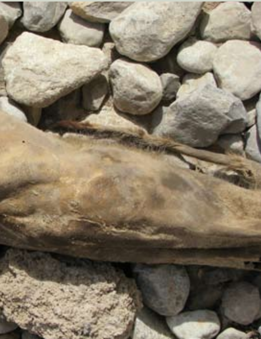
صورة ٢: جثة حيوان الكركال أزيلت من شجرة غاف في الامارات العربية المتحدة