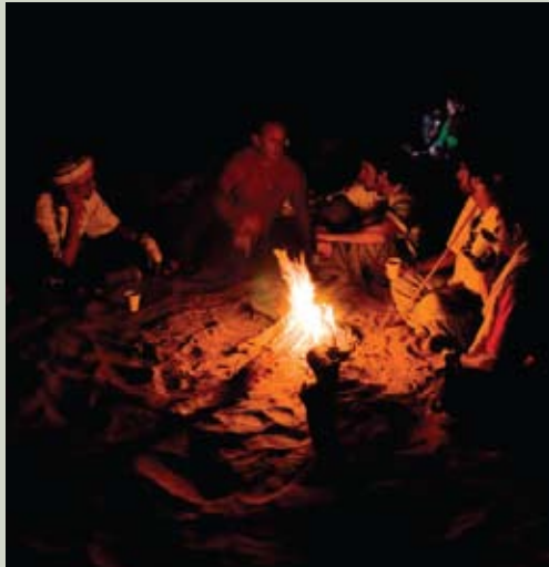
صورة ٢: المخيم في تلال الرمال المرتفعة