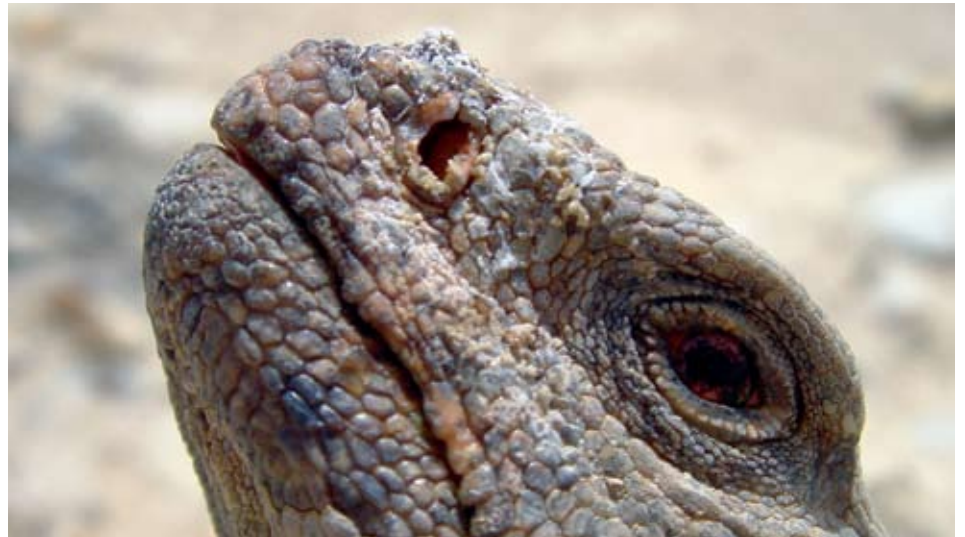
صورة ١: سحلية شائكة الذيل (الضب) في محمية الريم القطرية للمحيط الحيوي، قطر

يعالج الفصل الثاني منطقة البحث، محمية الريم القطرية للمحيط الحيوي. يقدم هذا الفصل معلومات عن المحمية، وصفاتها الطبيعية، واستخداماتها الحديثة، وإمكاناتها السياحية، والتضارب والمشاكل الجارية. كما يوضح خلفية وتطورات إعلانها كمحمية يونسكو للمحيط الحيوي. كان من أهم اكتشافات دراسة حالة محمية الريم القطرية للمحيط الحيوي، أنها مثال فريد للموئل والثقافة العربية، وتقدم فرصا وإمكانات هامة للسياحة الرفيقة بالبيئة، مرتبطة بتحديات التطوير والصون. إن تنوع الحيوان والنبات والمشاهد الطبيعية، وكذلك العمار التقليدية يمكن أن تكون جد جذابة للسياح المحليين ومن المنطقة والعالم.