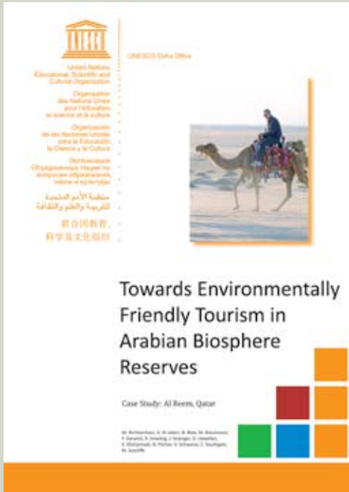
صورة ٢: غلاف كتاب «Towards Environmentally Friendly Tourism in Arabian Biosphere Reserves» (إصدار يونسكو ٢٠٠٩)