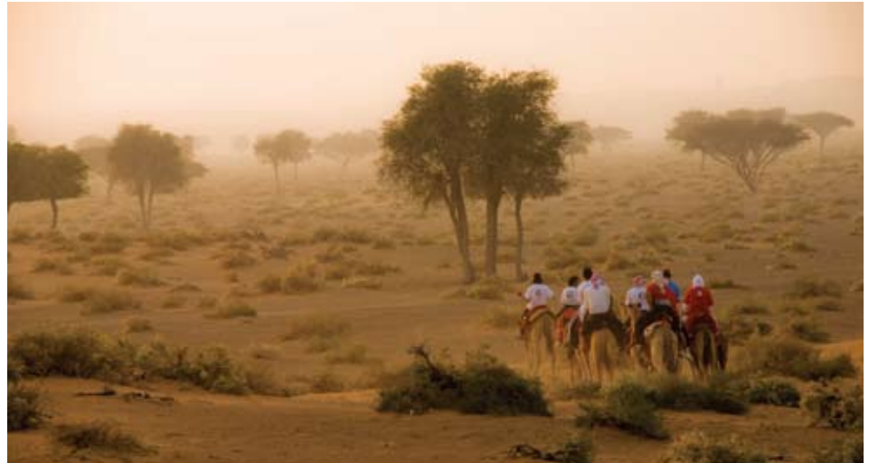
صورة ١: الغروب في سهول السفانا