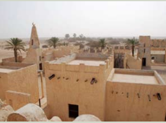
صورة ٢: قرية عربية في محمية الريم القطرية للمحيط الحيوي

يلفت الفصل الثالث الاهتمام إلى تشكيلة من المقترحات حول فرص السياحة الرفيقة بالبيئة في محميات المحيط الحيوي العربية. تضم هذه المقترحات النشاطات السياحية العامة كمشاهدات الترفيه في الطبيعة، والمباني الرفيقة بالبيئة، ومزارع مبتكرة للجمال، ونظام الحمى التقليدي، وكذلك فرص إنشاء حدائق نباتية قرآنية.