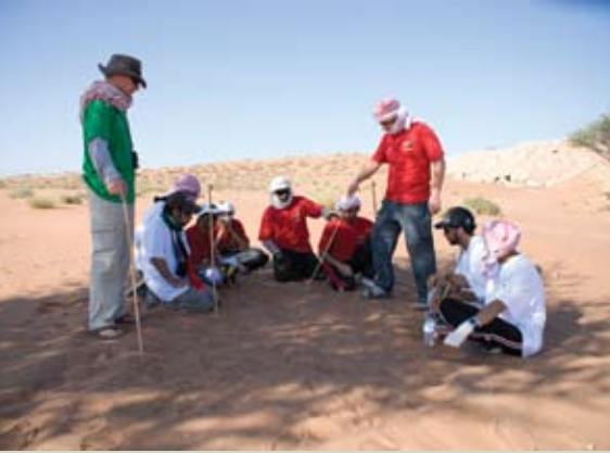
صورة ٢: المؤلف يناقش رحلة اليوم التالي

وصلنا بعد ٣٥ كيلومتراً وسبعة ساعات مضنية من الركوب إلى موقع مخيمنا الأول على هضبة في جبال الحجر تطل على السهول الواقعة على بعد آلاف الأقدام أسفلنا، باشرنا بعقل الجمال وضرب المخيم وإعداد الطعام، ثم ناقشنا حول المجلس أثناء وجبة العشاء إنجازاتنا وما تعلمناه من هذه التجربة. كانت حياتنا تدور كحياة الأجداد حول