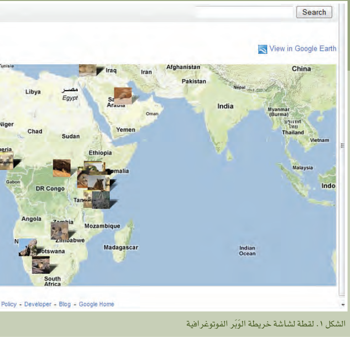
الشكل ١. لقطة لشاشة خريطة الوِبَر الفوتوغرافية