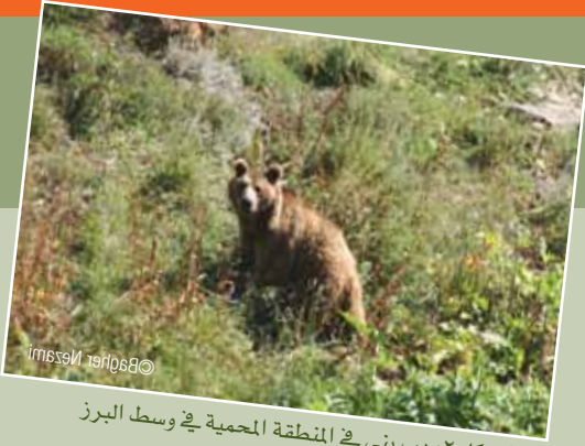
الشكل ٢: دب بني في المنطقة المحمية في وسط البرز

شوهدت ١١٥ من الدببة البنية ٤٥ مرة أثناء الاستقصاء، وجرت ١٠ مشاهدات فردية في الربيع، أما الباقي (٨١٪) فكانت في الصيف. رغم عمليات المسح الحقلية المستمرة فإننا لم نتمكن من مشاهدة الحيوانات في الخريف والشتاء، سوى بعض الآثار الحديثة المتفرقة في بداية ديسمبر، وبلغت لقاءاتنا مع الدببة ذروتها بين شهري يونيو وأغسطس عندما تكون نشطة للغاية في المرتفعات العليا. بلغ حساب متوسط حجم الحضنة للدببة البنية في محمية جولستانانك ٢ لكل حضنة أشبال من مواليد العام وهو أقل بالمقارنة مع الأعداد الأوروبية.