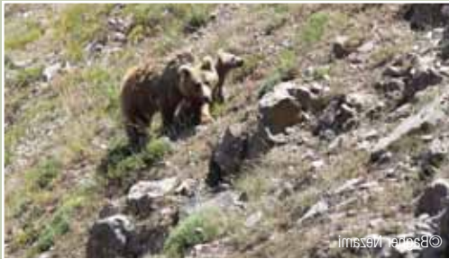
الشكل ٢: دب بني في المنطقة المحمية في وسط البرز

شوهدت ١١٥ من الدببة البنية ٤٥ مرة أثناء الاستقصاء، وجرت ١٠ مشاهدات فردية في الربيع، أما الباقي (٨١٪) فكانت في الصيف. رغم عمليات المسح الحقلية المستمرة فإننا لم نتمكن من مشاهدة الحيوانات في الخريف والشتاء، سوى بعض الآثار الحديثة المتفرقة في بداية ديسمبر، وبلغت لقاءاتنا مع الدببة ذروتها بين شهري يونيو وأغسطس عندما تكون نشطة للغاية في المرتفعات العليا. بلغ حساب متوسط حجم الحضنة للدببة البنية في محمية جولستانانك ٢ لكل حضنة أشبال من مواليد العام وهو أقل بالمقارنة مع الأعداد الأوروبية.