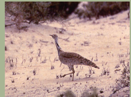
Houbara bustard ( Chlamydotis undulata ).

حالة الدجاج البري المتموج Houbara Chlamydotis في خمسة مواطن له في إيران