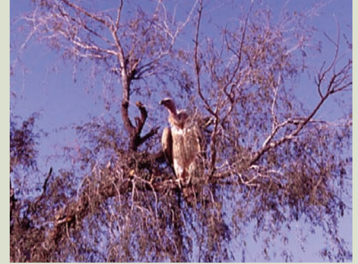
Griffon vulture in Oman ( Gyps fulvus ).

متابعة النسور من القوقاز إلى إيران McGrady, M. & Gavashelishvili, A. podoces, 2006, 1(1/2):21-26